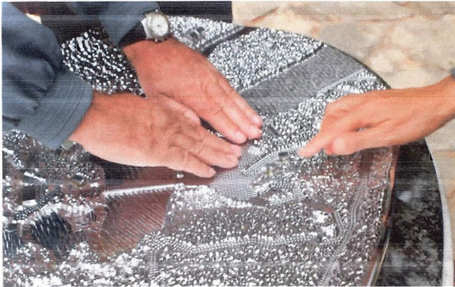
„ пипање „