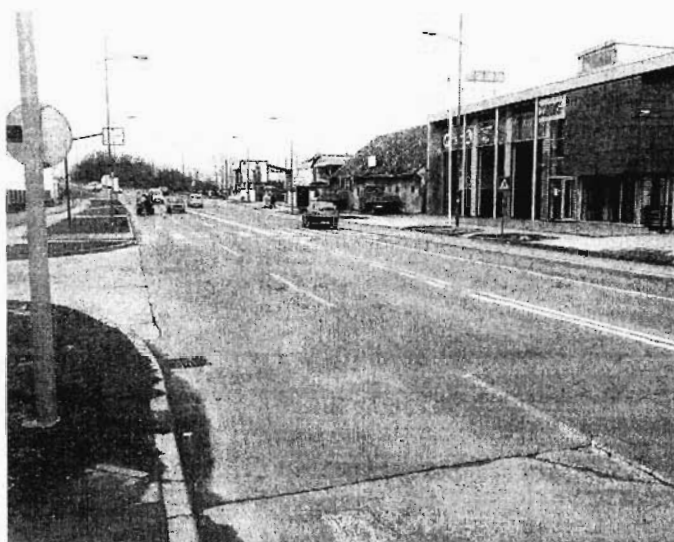
Слика 2: Приказ постојећег стања зоне пешачког прелаза на укрштања улица Темеринске и Шајкашке у Новом Саду