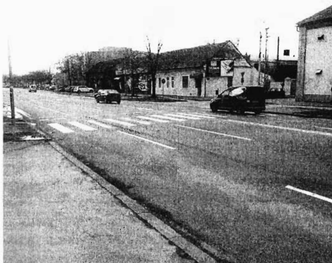
Слика 1: Приказ постојећег стања зоне пешачког прелаза на укрштања улица Темеринске и Шајкашке у Новом Саду