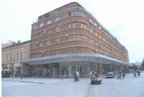
** на надстрешници у слободном паду h=300cm

ред. бр. Декоративни мотив – опис и карактеристике