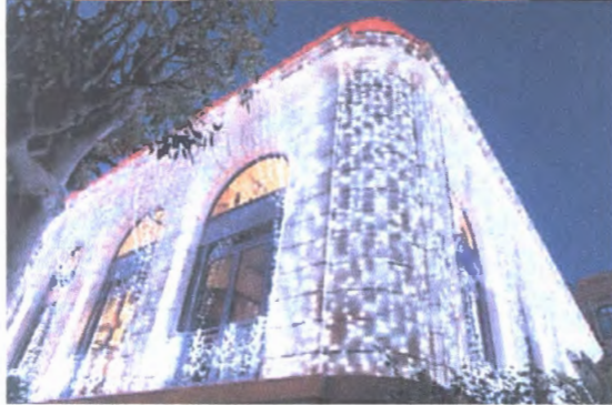
** примери на фасадама