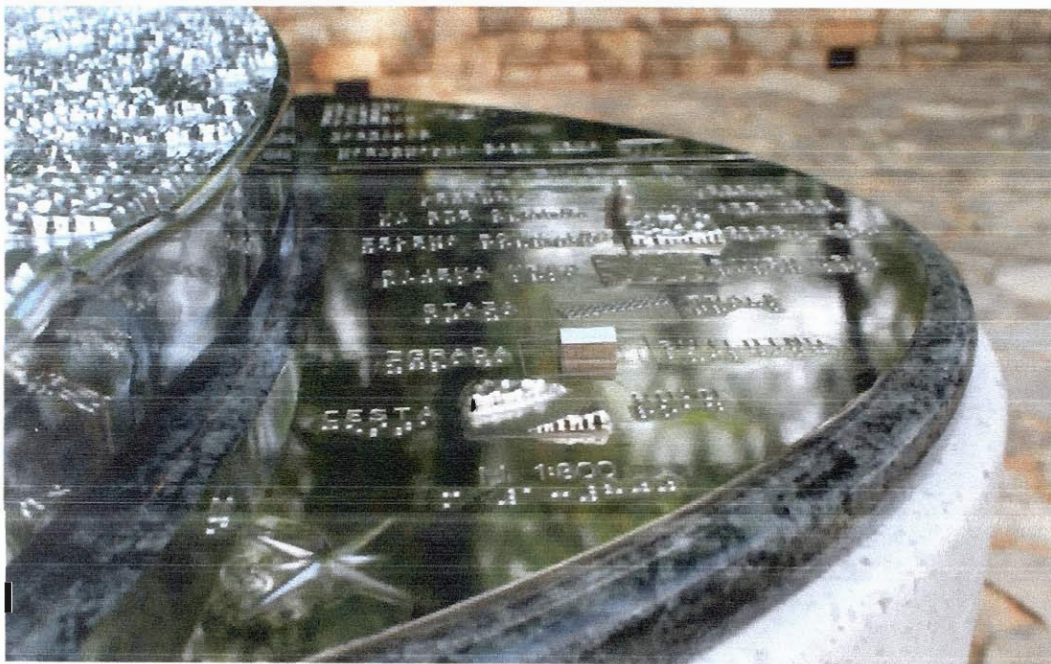
„Брахјево“ писмо - сет алфанумеричких знакова