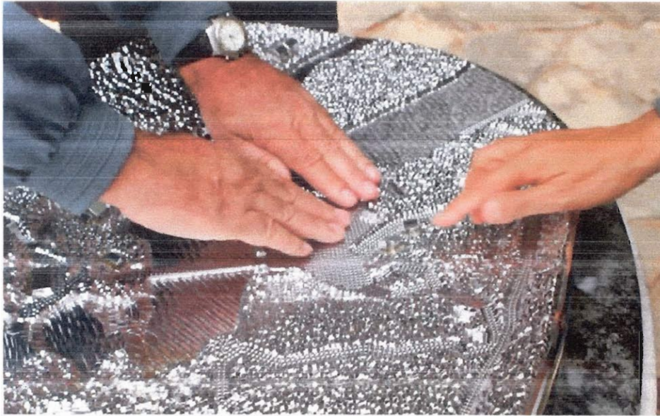
„ пипање „