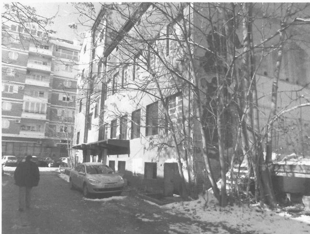
Објекат број 5