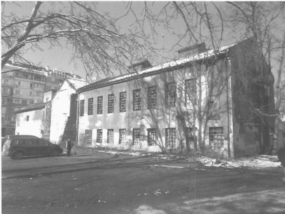
Објекат број 4